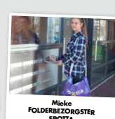
Mieke FOLDERZORGERSTER SPOTTA

Ik merk dat een groot deel van onze klanten speciaal voor de sticker komt. Dus als er minder folders worden verspreid, vrees ik dat we moeten bezwaigen en de banen liggen niet voor het oprapen.